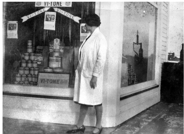
2 27 novembre 1929

Elle n'a pas froid aux yeux et est avant-gardiste pour son siècle. Elle acquiert un niveau d'instruction inhabituel pour une femme à cette époque, et complète un cours commercial, très respecté à l'époque. Pendant un certain temps, elle ira vivre aux États-Unis où elle travaillera dans une manufacture.