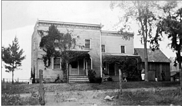
1 Maison paternelle au rang des Écossais à Sainte-Brigide

En 1928, à l'âge de 36 ans, elle s'établit à Montréal, où elle représente la compagnie Vi-Tone qui produit du lait au chocolat, breuvage tonique et nourrissant à base de malt et de lait, renfermant toutes les protéines et vitamines contenues dans la fève soya. Elle ne ménage pas ses efforts, elle fait des démonstrations un peu partout dans la province et se rend jusqu'en Gaspésie et aux États-Unis. Elle se déplace habituellement en train. Les chemins n'étant pas ouverts l'hiver, elle parcourt les villages en sleigh.